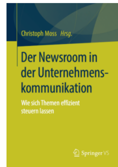
Buchcover "Der Newsroom in der Unternehmenskommunikation"

Mauern einreißen, Themen steuern, transparente Strukturen schaffen: Moderne Unternehmen arbeiten crossmedial. Sie bedienen eine Vielzahl von Kanälen für eine Vielzahl von Zielgruppen aus einer zentralen Steuerungseinheit heraus: dem Newsroom.